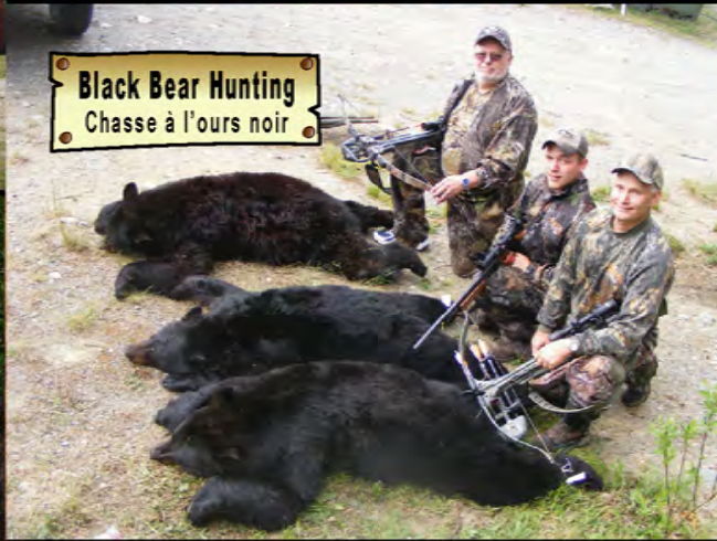
Black Bear Hunting Chasse à l'ours noir