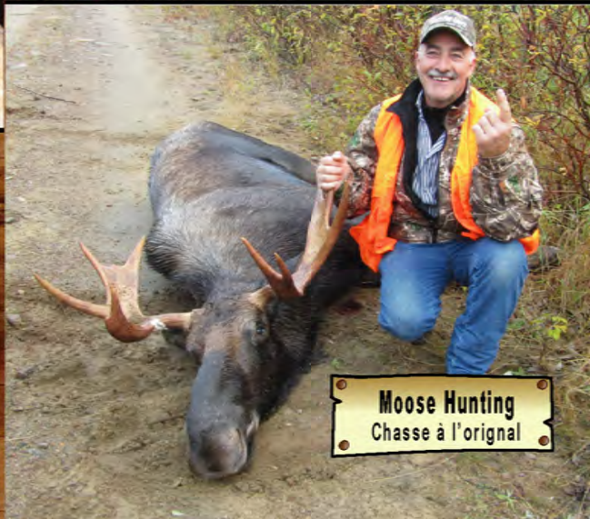
Moose Hunting Chasse à l'original